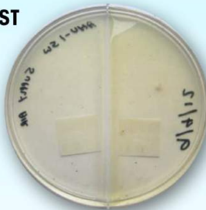
Después de Steril-Aire