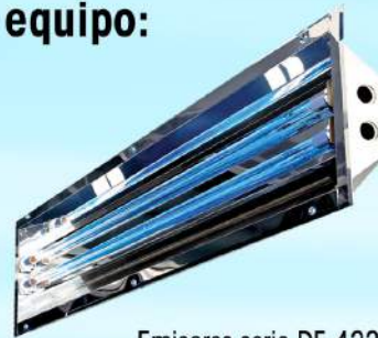
Emisores serie DE 422 para techo