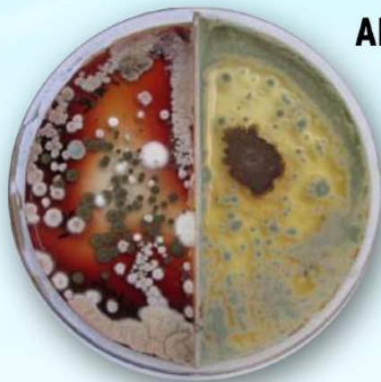
Antes de Steril-Aire